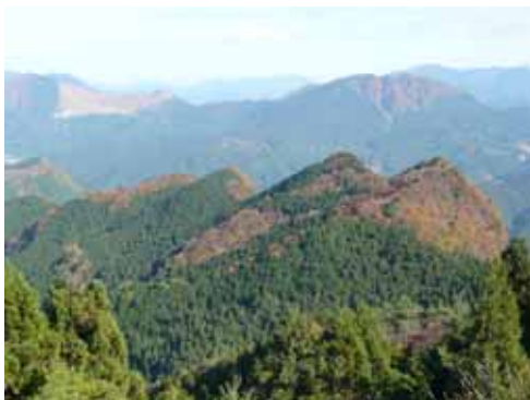
住塚山から 曾爾高原方面 13:49