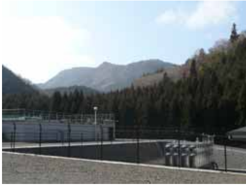
出発点から 尼ヶ岳 10:36