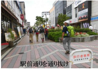
駅前通りを通り抜け