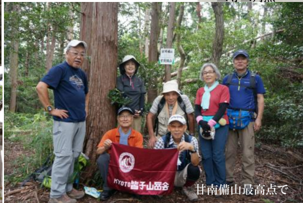
甘南備山最高点で