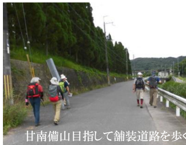
甘南備山目指して舗装道路を歩く