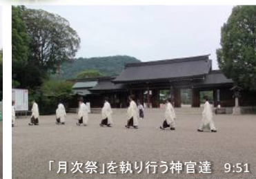
「月次祭」を執り行う神官達 9:51