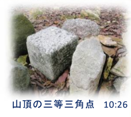
山頂の三等三角点 10:26