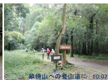
畝傍山への登山道に 10:02