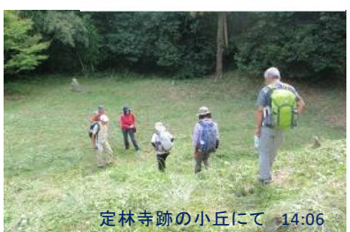
定林寺跡の小丘にて 14:06