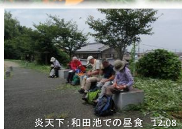
炎天下:和田池での昼食 12:08