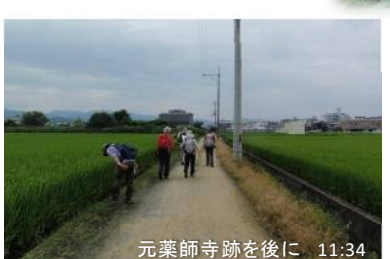
元薬師寺跡を後に 11:34