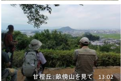
甘樫丘:畝傍山を見て 13:02