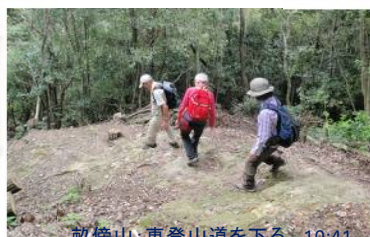
畝傍山:東登山道を下る 10:41