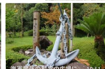
海軍関係の慰霊の広場に 10:51