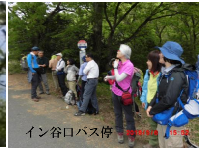
イン谷口バス停 2018/5/6 15:52

比良駅⇒イン谷口⇒ノタノホリ⇒堂満岳⇒金糞峠 →アオガレ→大山口⇒イン谷口⇒比良駅