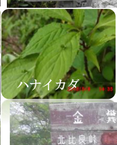
ハナイカダ 2018/5/6 11:35