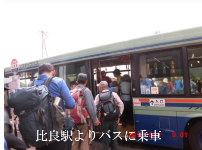
比良駅よりバスに乗り 0-01