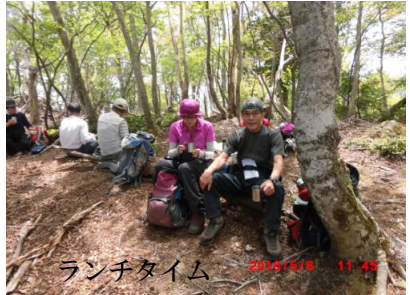
ランチタイム 2018/5/6 11:45