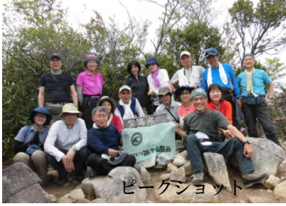
ピークジョイント