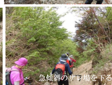
急傾斜のガレ場を下る