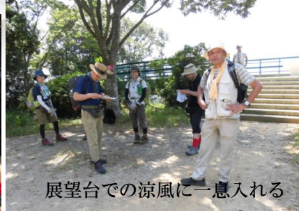
展望台での涼風に一息入れる