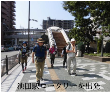
池田駅ロータリーを出発