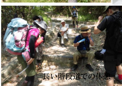
長い階段道での休憩