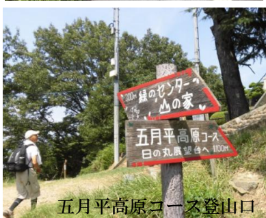
五月平高原コース登山口