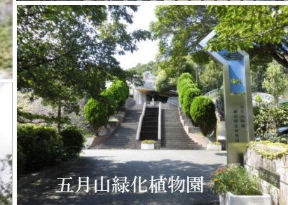
五月山緑化植物園