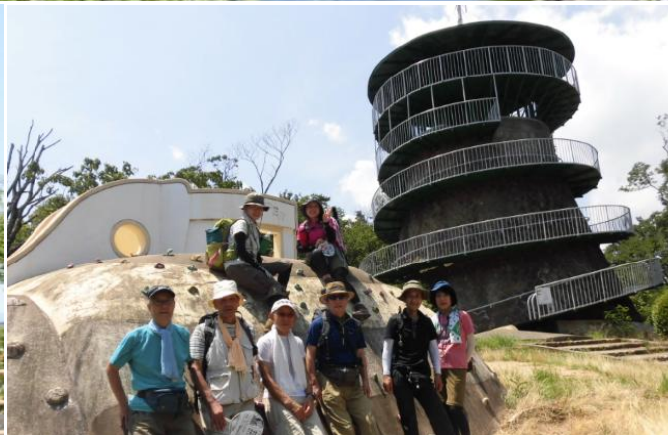
日の丸展望台をバックに