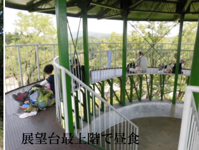
展望台最上階で昼食