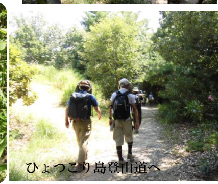
ひょうつこり島登山道へ