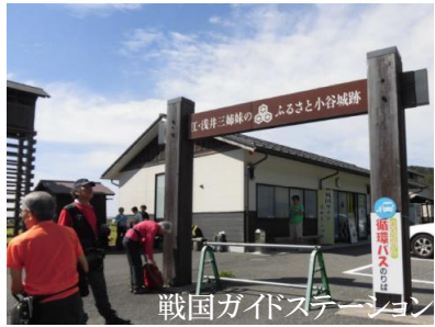
戦国ガイドステーション