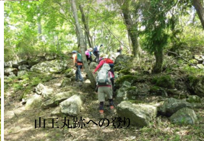
山王丸跡への登り