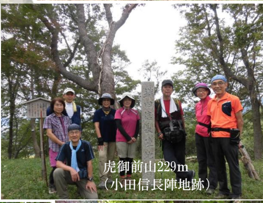
虎御前山229m (小田信長陣地跡)