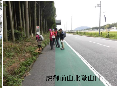
虎御前山北登山口