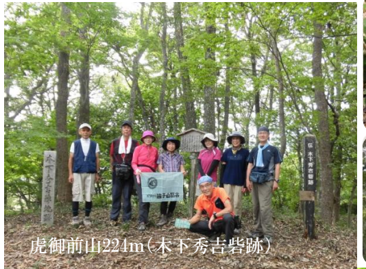
虎御前山224m(木下秀吉砦跡)