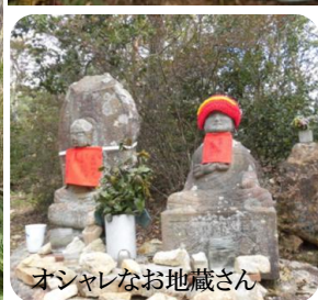
オシャレなお地藏さん