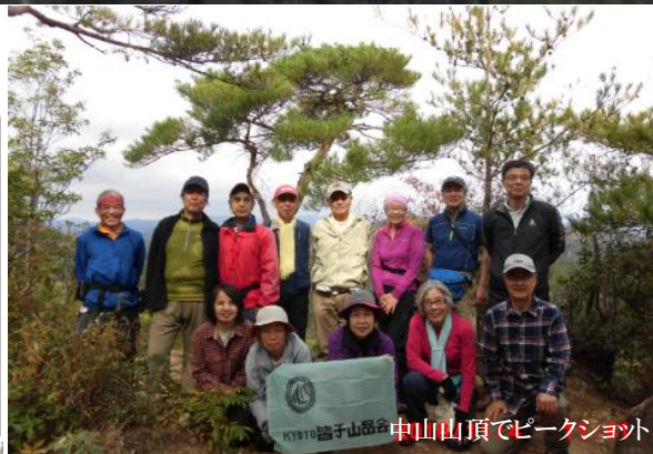
中山山頂でピークショット