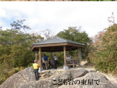
こども岩の東屋で