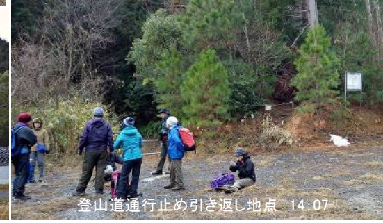
登山道通行止め引き返し地点 14:07