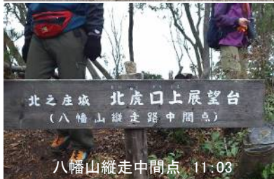
北之庄城 北虎口上展望台 (八幡山縦走路中間点) 八幡山縦走中間点 11:03