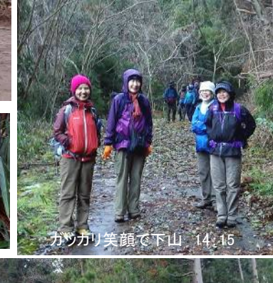
カツカリ笑顔で下山 14:15