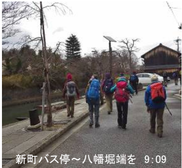
新町バス停～八幡堀端を 9:09