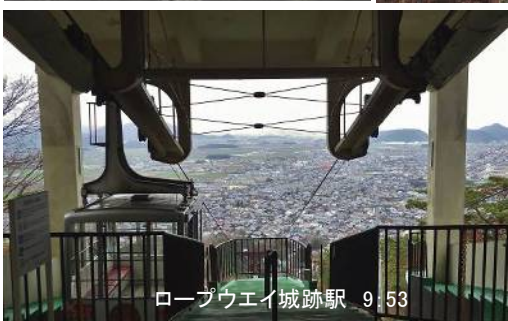
ローブウエイ城跡駅 9:53