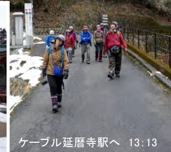
ケーブル延暦寺駅へ 13:13