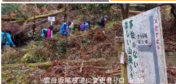
雲母坂尾根道に変更登り口 8:59