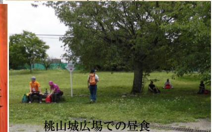
桃山城広場での昼食