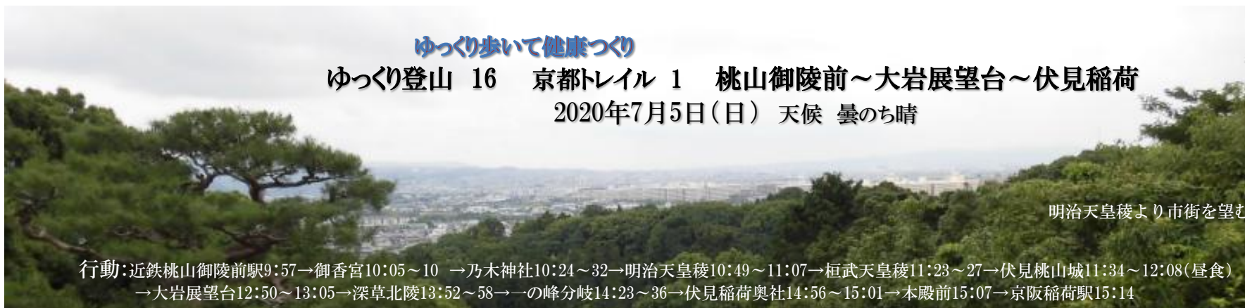
明治天皇陵より市街を望む

行動: 近鉄桃山御陵前駅9:57→御香宮10:05～10 →乃木神社10:24～32→明治天皇陵10:49～11:07→桓武天皇陵11:23～27→伏見桃山城11:34～12:08(昼食) →大岩展望台12:50～13:05→深草北陵13:52～58→一の峰分岐14:23～36→伏見稲荷奥社14:56～15:01→本殿前15:07→京阪稲荷駅15:14