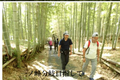
一の峰分岐目指して