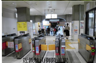
近鉄桃山御陵前駅

行動: 近鉄桃山御陵前駅9:57→御香宮10:05～10 →乃木神社10:24～32→明治天皇陵10:49～11:07→桓武天皇陵11:23～27→伏見桃山城11:34～12:08(昼食) →大岩展望台12:50～13:05→深草北陵13:52～58→一の峰分岐14:23～36→伏見稲荷奥社14:56～15:01→本殿前15:07→京阪稲荷駅15:14