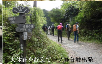
大休止を終えて一の峰分岐出発