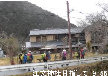
江文神社目指して 9:55