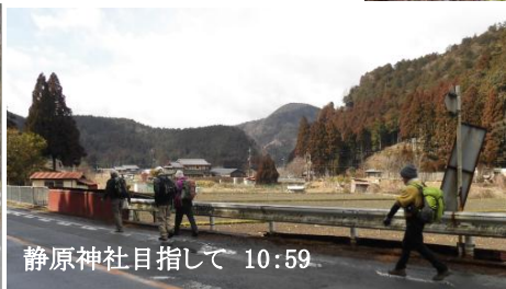
静原神社目指して 10:59