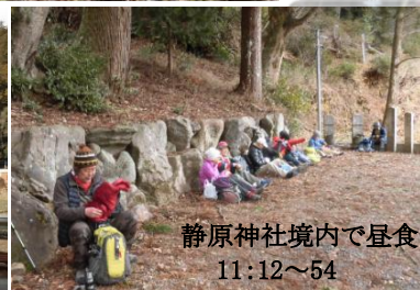
静原神社境内で昼食 11:12~54